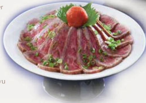
和牛タタキ 火炙和牛 Seared Wagyu $188