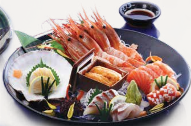
刺身盛り合わせ (5品盛り/4人前) (サーモン、ほたて貝、牡丹海老、うに、シマ鯨)