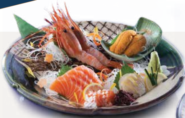
刺身盛り合わせ (4品盛り/2人前) $368 (サーモン、ほたて貝、牡丹海老、うに)