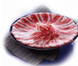
熊本産Rindo豚 熊本豚 Kumamoto Rindo Pork